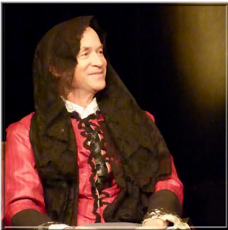
La Cousine Bette