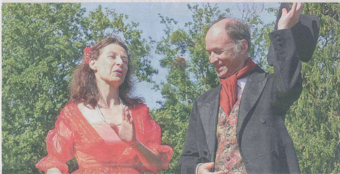
« Cousine Bette », par Promothéâtre, sera joué au Petit Fauchoux, samedi et dimanche, à 14 h 30.

L'année 2019 est l'occasion pour la ville de Tours de fêter le 220 e anniversaire de Balzac né à Tours. Ce week-end, gros temps fort des célébrations qui se prolongeront jusqu'au 20 mai, jour de sa naissance.