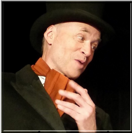
Le baron Hulot